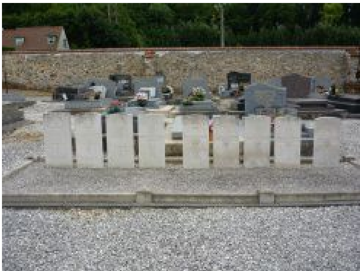
Six tombes de soldats britanniques au cimetière de Bellot tombés le 8 septembre 1914

Pour en savoir plus : http://www.sambre-marne-yser.be/article.php3?id_article=78